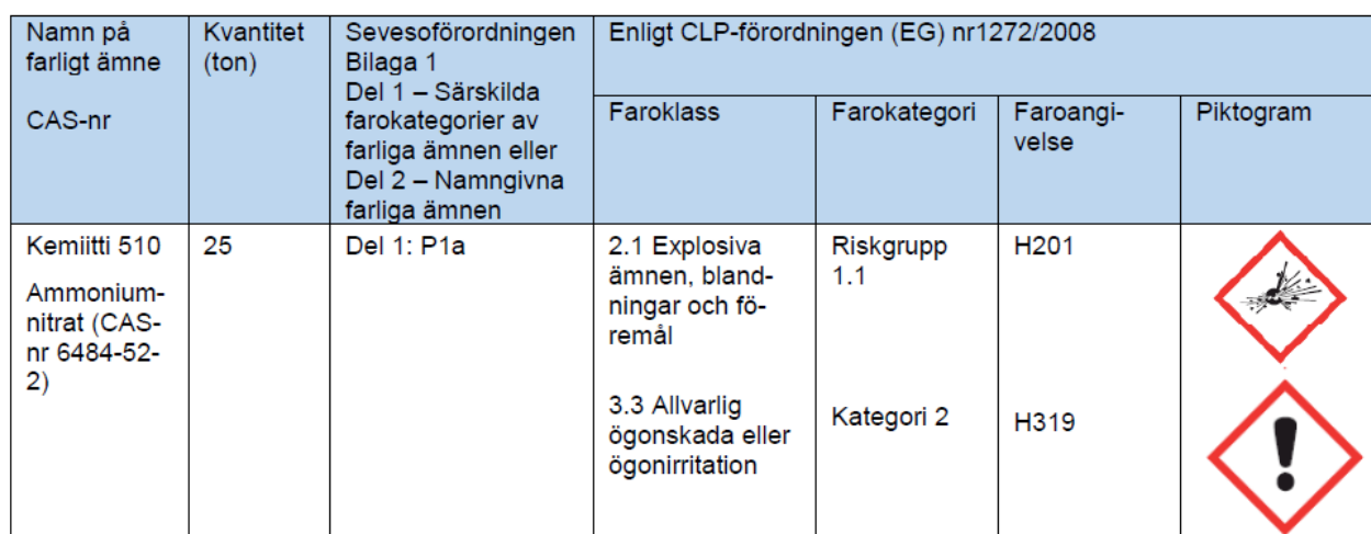
Tabell 1.2 Faroklassificering och kod för faroangivelse redovisas enbart för ämnen som omfattas av SFS